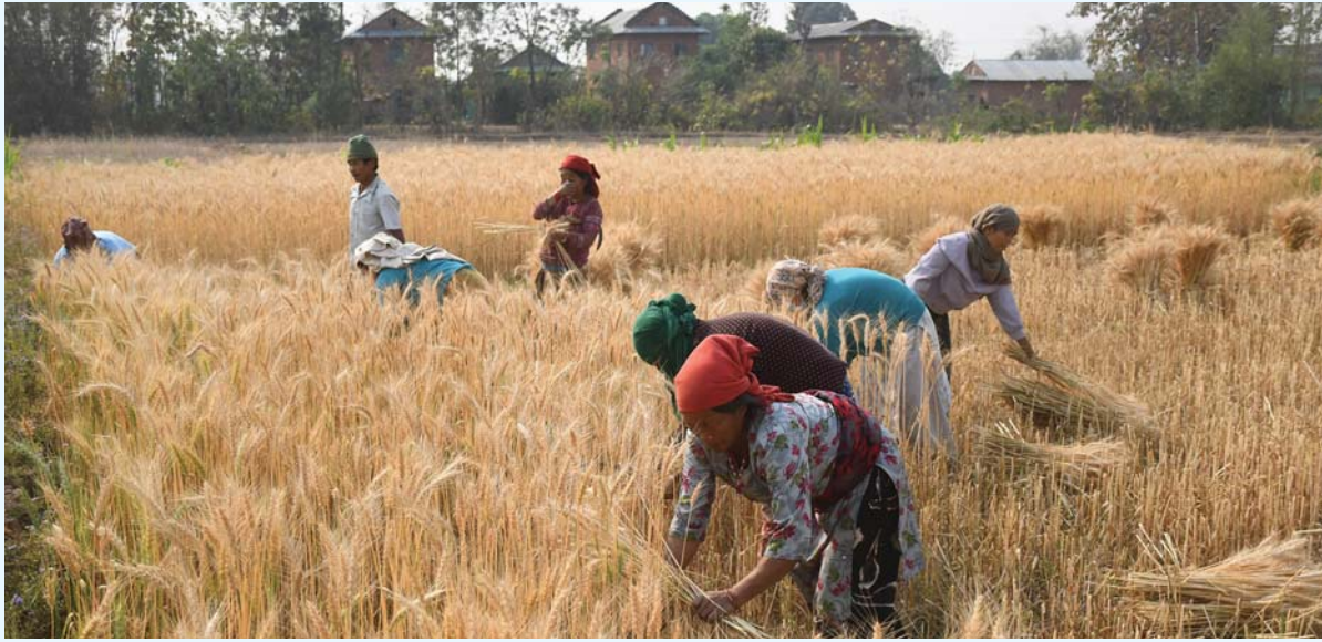
गढा मित्रयाउने वटारी | दाङको घोरही उपमहानगरपालिका-१२ स्थित हापुर रमाना क्षेत्रमा गहुँ काट्दै गरेका स्थानीय किसान ।