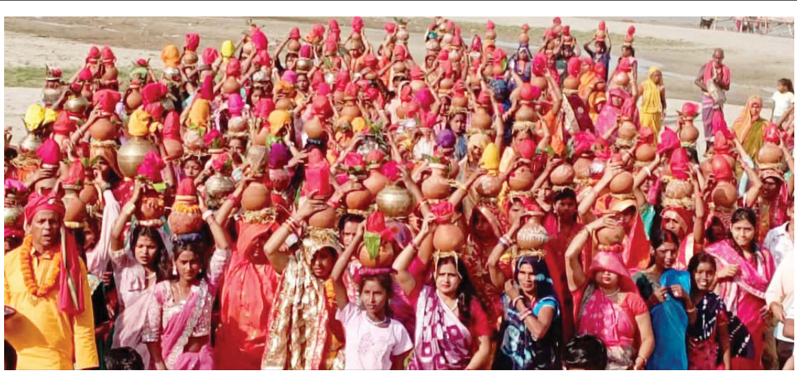
कलशमा जल ल्याउँदै | धनुषाको कमला नगरपालिका-५ लकरस्थित आइतबार श्री श्री श्री १०८ हनुमान मन्दिरमा भएको अष्टजामका लागि कमला नदीबाट कलशमा जल भरेर ल्याउँदै भक्तजन ।