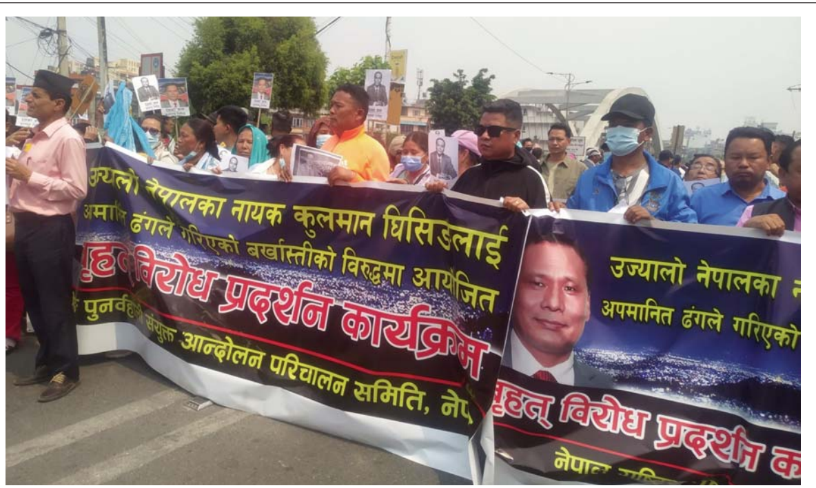
नेपाल विद्युत् प्राधिकरणको कार्यकारी निर्देशकबाट कुलमान घिसिङलाई बर्खास्त गर्ने सरकारको निर्णयविरुद्ध आइतबार काठमाडौंमा आयोजित विरोध ज्वालीमा सहभागी। 'कुलमान देशको शान' लगायत नारासहितको प्लेकार्डसहित हजारौंको संख्यामा कुलमानका समर्थकहरू ज्वालीमा सहभागी भएका थिए।